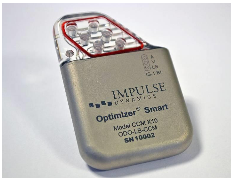
Figura 1: IPG OPTIMIZER Smart

La durata prevista dell'IPG OPTIMIZER Smart è limitata dalla durata di servizio prevista della relativa batteria ricaricabile. La batteria ricaricabile all'interno dell'IPG OPTIMIZER Smart dovrebbe offrire almeno 15 anni di servizio. Nel tempo e con il caricamento ripetuto, la batteria contenuta nell'IPG OPTIMIZER Smart non sarà più in grado di recuperare la piena capacità di carica.