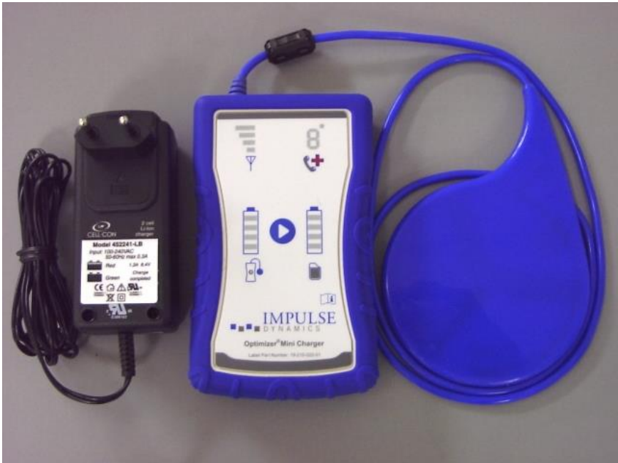
Figura 3: Mini-caricatore OPTIMIZER con Adattatore CA