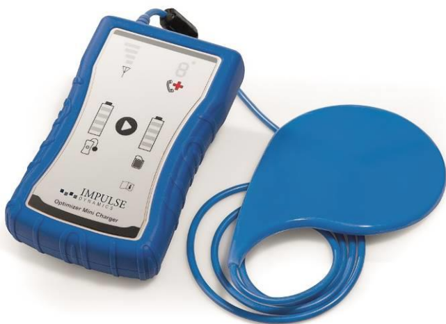
Figura 2: Mini-caricatore OPTIMIZER

Anche il Mini-caricatore OPTIMIZER è alimentato da una batteria ricaricabile. La bacchetta di caricamento è collegata in modo permanente al dispositivo tramite un cavo sufficientemente lungo da consentirLe di posizionare il caricatore fino a 0,5 m (~20 pollici) di distanza da Lei. Il processo di caricamento si avvia automaticamente senza richiedere un intervento significativo dell'utente. Faccia riferimento alla Sezione 7 di questo manuale per i dettagli sul funzionamento corretto del caricatore.